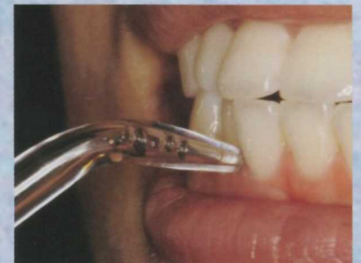
水圧を 10 段階でコントロール、口腔内をきめ細かく洗浄します。