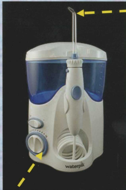
この先から水が出ます。